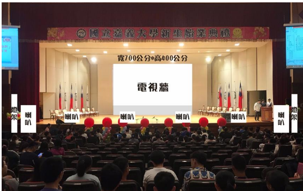
<螢幕底座平台> <寬 720*深 180 公分*高 60 公分>