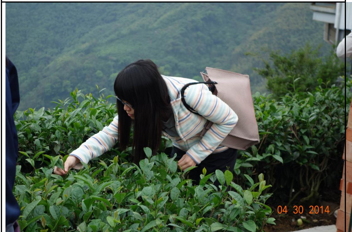
照片(二)說明 同學們依照採茶標準採茶