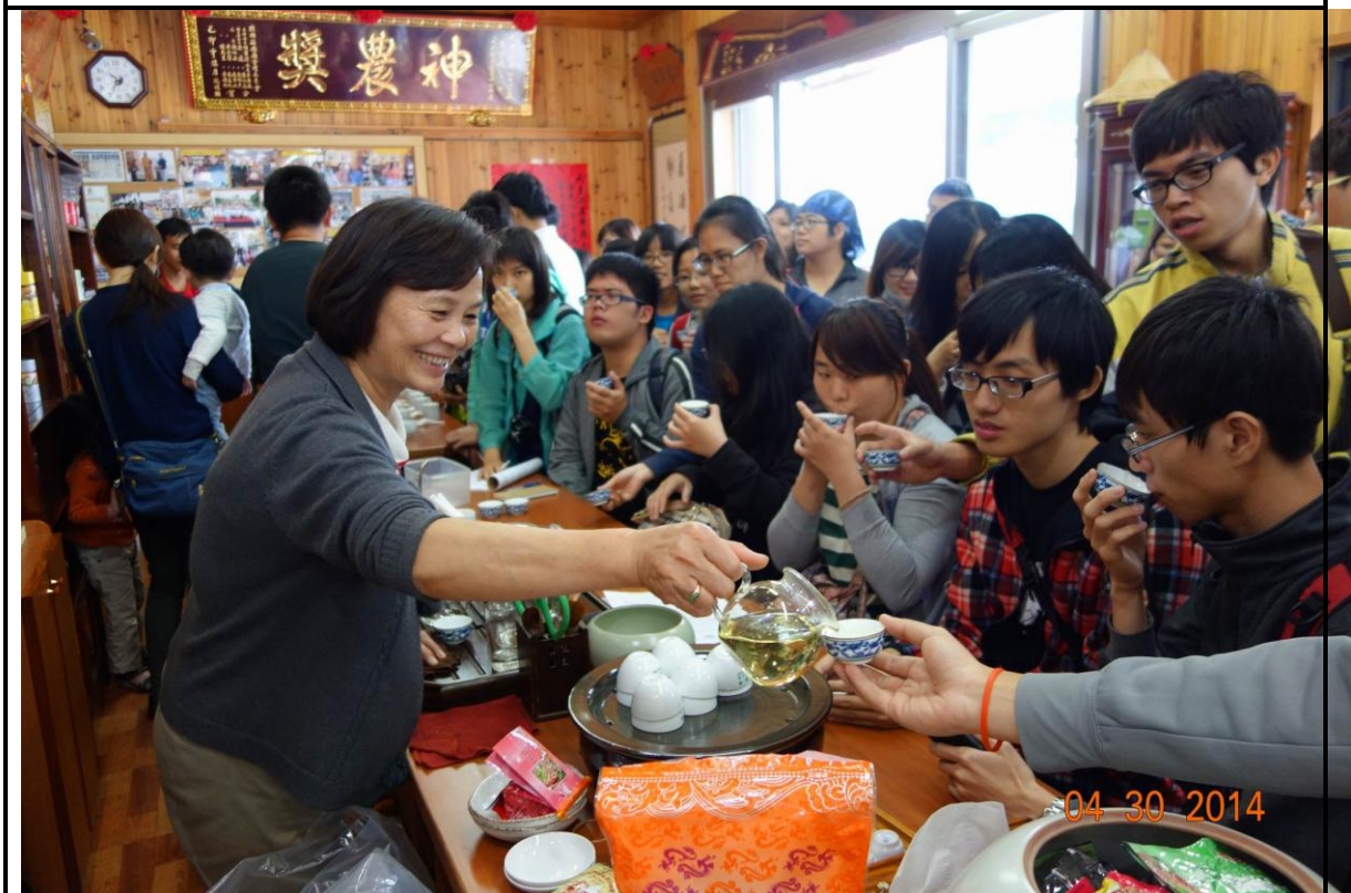
照片(六)說明 試喝高山茶