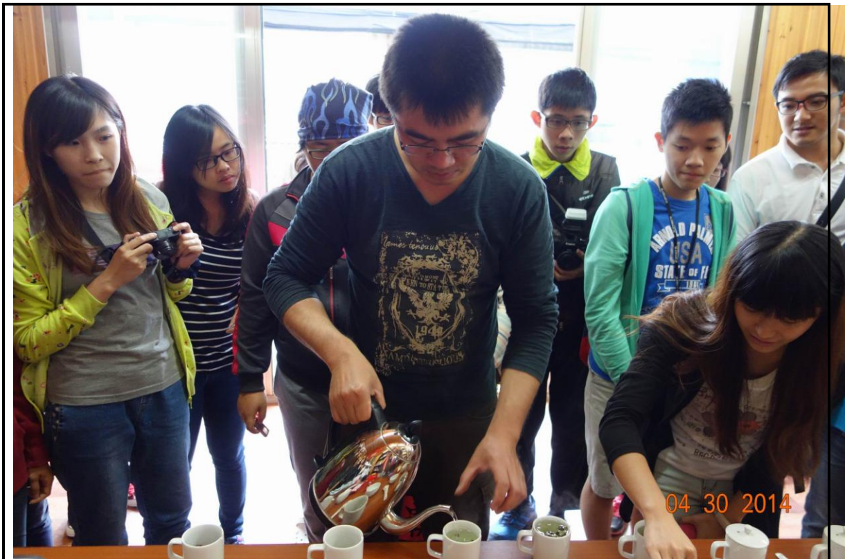
照片(五)說明 茶葉官能品評