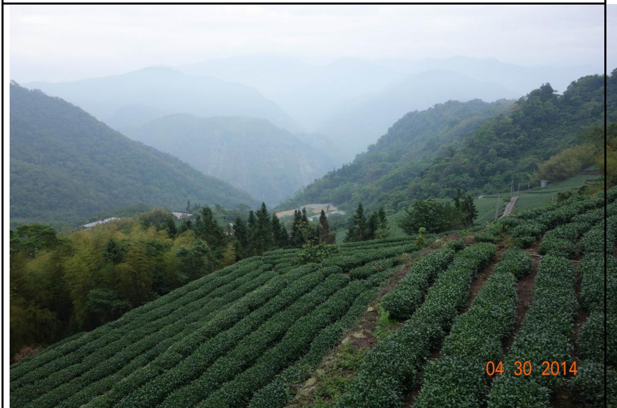
照片(四)說明 參訪當天茶園景緻