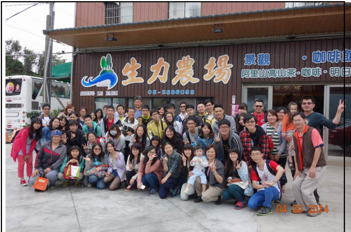
照片(三)說明 全體大合照