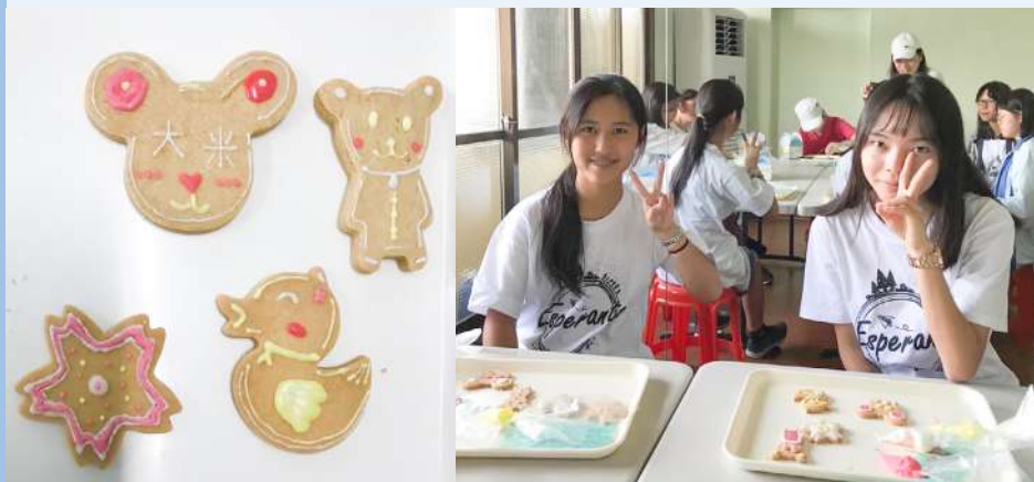
◀ (左) 烘焙坊餅乾成品 (右) 餅乾裝飾完工