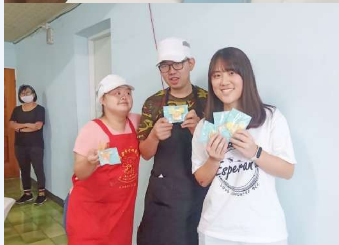
▲（上）為餅乾進行包裝 （下）完成餅乾後的我和合作夥伴