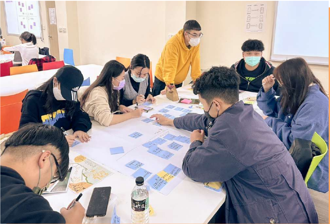
▲ 111 學年同學們在課堂討論服務對象的需求