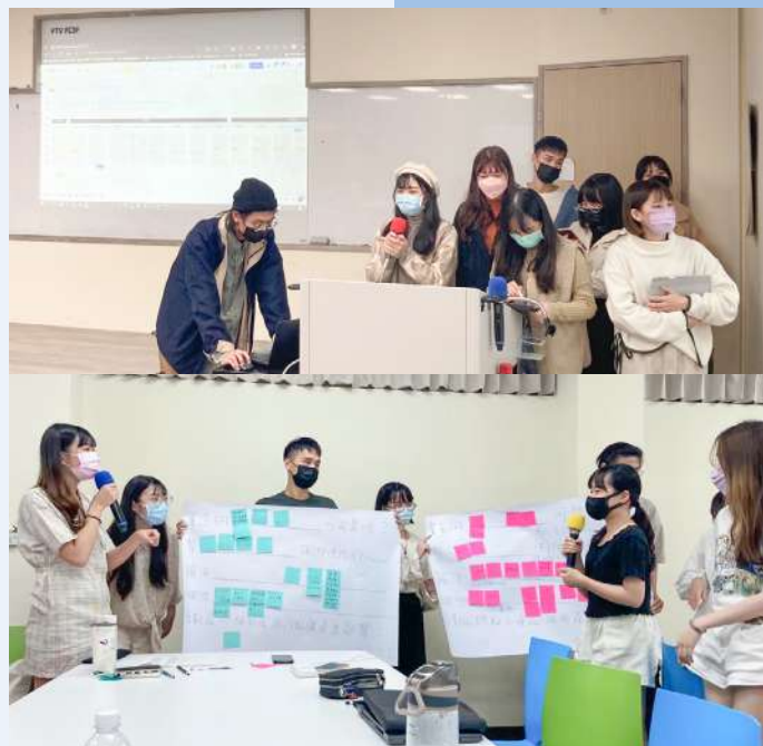
▲ (上) 學生於課堂中報告團隊進度 (下) 學生於課堂上分享討論成果

過程真的很漫長、很辛苦，學生表示，為了製作出有效的宣傳廣告，他們想出超過十個方案，卻每次被老師或業主反駁。但這些挫折並沒有使同學們放棄，而是成為下一次提案的養分，在反覆修改、驗證與堅持不懈的努力之下，最後學生們製作出可行且完整的方案——拍攝兩支廣告短片，分別陳述脊損傷友現況及主動廚房「以工代賑」之理念，希望激起大眾對此議題的關注與反思。