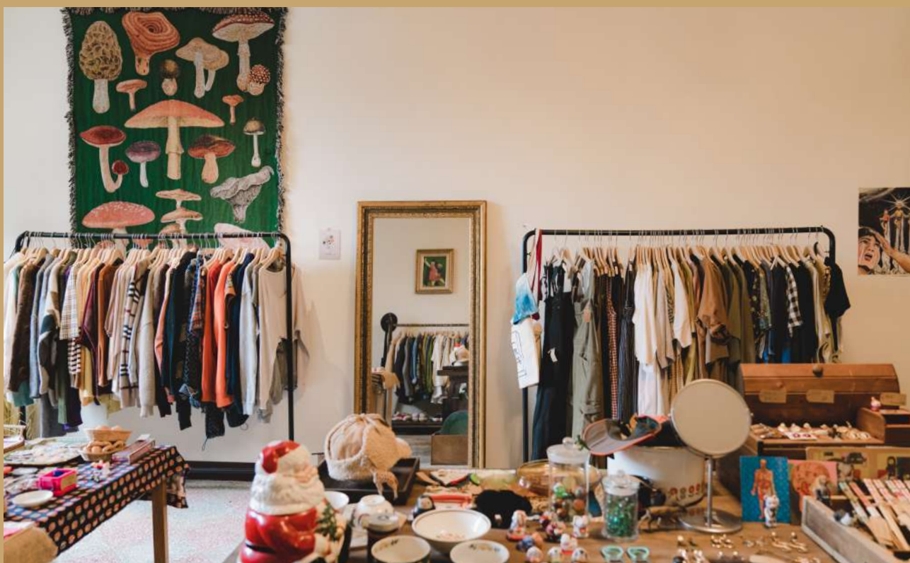
▲ 二手物選購區，這裡有你的童年嗎？

對於無包裝的推廣，面對第一次光顧的客人，難免會遇到沒有自備環保容器的問題，這時店家會提供免費的二手容器讓顧客運用，在使用二手容器的同時，店家也會徵收民眾不常使用的二手容器，主要希望獲得有蓋子的玻璃罐或是紙袋。在推廣無包裝理念的同時，日日籽商行也透過「提供」及「收取」二手容器的方式讓顧客習慣無包裝的購買方式，也讓二手容器有一個循環使用的契機。店家以自身開始出發，讓大眾知道環保的實施並不困難，只要有心，人人都可以是推廣的助手。