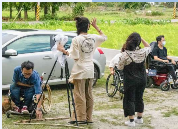
▼ 學生團隊前往花蓮拍攝

擁有不同專長的兩系學生在課堂中協作、磨合，發揮各自的專長，課程豐富的資源與老師積極的指引讓他們獲得了很大的進步，參加這堂課後，學生們意識到原來自己也能達成關懷與服務生命的實踐目標，對社會有所貢獻。