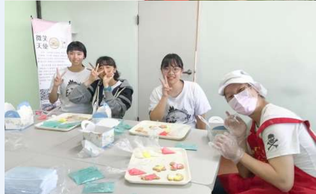
▲ (上) 微笑天使工作坊大合照 (下) 和身心障礙人士一同製作欲販售的餅乾