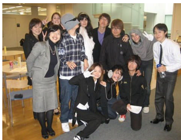
日語集中訓練班各國學生合影