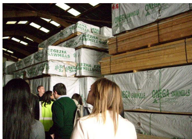
學校安排參觀南特最大的木材進口工廠