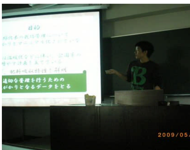
專題討論增進同學間的互動

留學中最寶貴的事情中，我想在學校中的學習必然重要，但是更重要的是體會了種種經歷過的事，特別是與來自不同文化背景的人一起處事，而在過程中，了解對方對某事的想法，並且學習與包容，而將會有所成長。