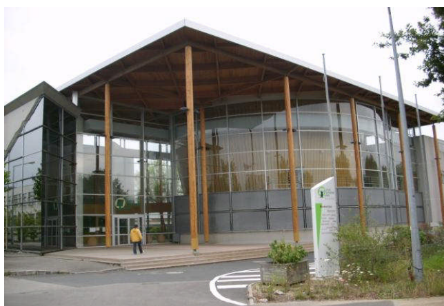
南特林業高等學院大門口

我覺得未來要前往就讀同學最好需具備一定的英文或法語能力，因為語言是必要的工具，否則生活起居方面可能就比較辛苦，抱持愉快的心情，只要願意學習發問，不論是各國人種都相當願意指導，要不畏懼開口才會學到得到你想要的東西。較困難的情況是發生在剛到達法國的時候，為了在那邊生活，必須要辦理一些相關的手續，需要麻煩到許多人，也正因為不懂所以我們更要去積極詢問；一開始去搭車跟查時刻表，因為是法文操作介面所以有些困難，其餘就是人際溝通方面，而金錢方面則要視個人的經濟狀況而定。