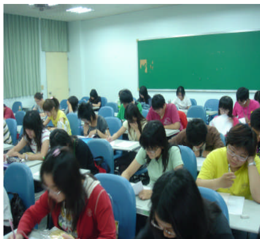
基礎學科學力競賽情形

基本能力是培養學生帶得走能力的基石。基本能力佳的學生，在專業上的表現，會較一般學生有勝出的機會。有良好的基本能力，才有機會培養關鍵競爭力。目前學生的基本能力中，以語文表達能力較為需要補強，除了國際語言的英文外，甚至是中文的寫作與表達都需大幅度的加強，這對學生未來競爭力有著關鍵性的影響。此外，現今教育趨向多元化發展，又因大學校院遽增，出生率下降，導致大學錄取率的提高，進入大學的學生素質正逐年滑落，大一學生的物理、化學、微積分等基礎學科的程度愈來愈差，如